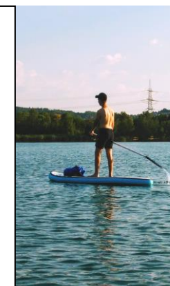
Stand-Up-Paddling auf dem Singliser See