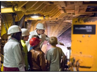
Spannende Führungen untertage. Hier am Schildausbau im Besucherstollen