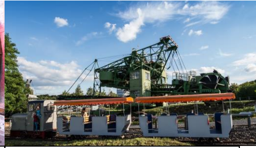
Besucherbahn vor dem Schaufelradbagger im Themenpark Kohle & Energie