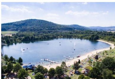
Der Naturbadesee Stockelache ist ein beliebtes Ausflugsziel