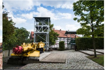
Förderturm und Streckenvortriebsmaschine sind vor dem Gebäude zu sehen