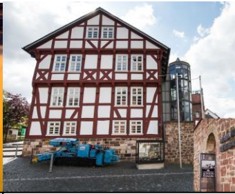
Der Besucherstollen befindet sich unter dem alten Amtsgericht von Borken