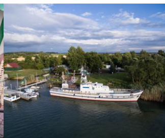
Singliser See mit Blick auf das ehemalige Küstenwachboot „KW18“