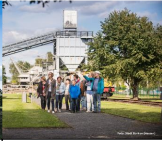
Besuchergruppe vor dem Kohlebunker im Themenpark Kohle & Energie