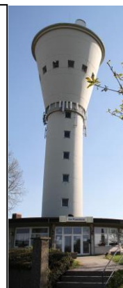
Der Wasserturm gilt als Wahrzeichen der Stadt