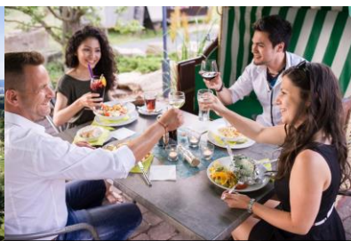
Vom Biergarten oder vom Innenraum des Seerestaurants am Naturbadesee Stockelache hat man einen schönen Seeblick