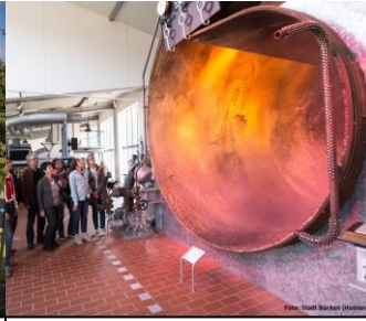
Der Kraftwerksskessel auch „rauchender Schlot“ genannt im Themenparks Kohle & Energie