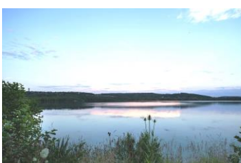
Das Naturschutzgebiet Borkener See bietet viele Einblicke in die Natur.