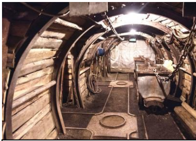
Originalgetreuer Stollen Alle Maschinen werden in demonstrationsbetrieb vorgeführt