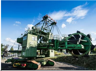
Der imposante Schaufelradbagger ist das Leitexponat im Themenpark Kohle & Energie