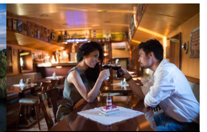
Maritime Atmosphäre unter Deck des KW 18