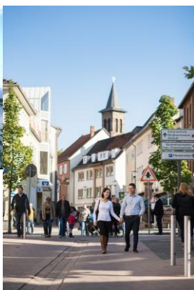
Die Borkener Innenstadt lädt zum Verweilen ein